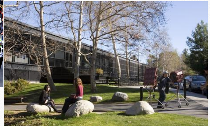
Art Center College of Design