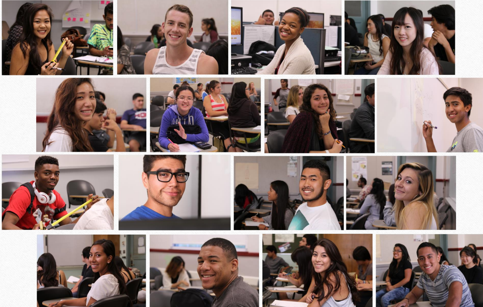
Pasadena City College