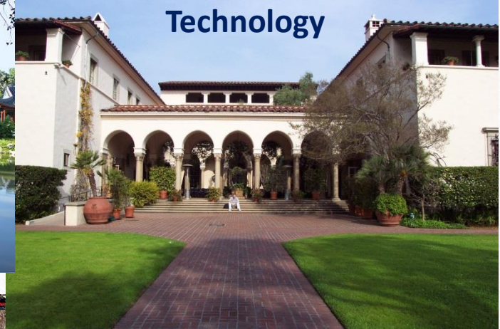
California Institute of Technology