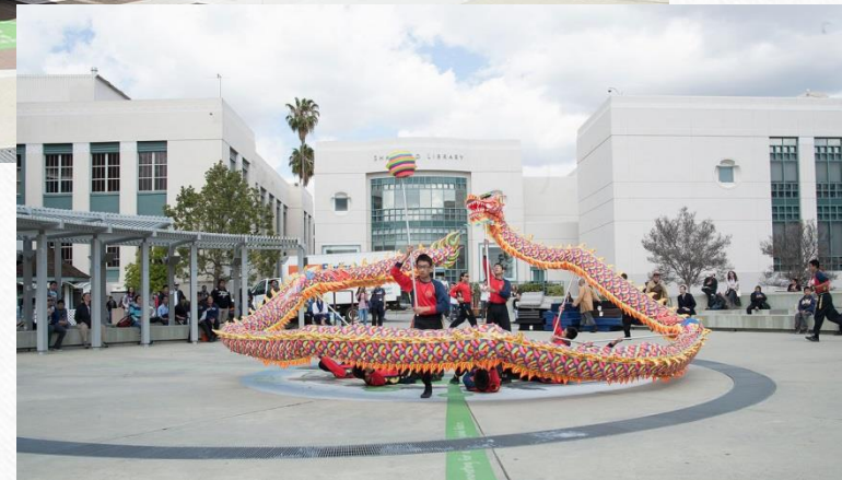
Chinese Culture Week at PCC