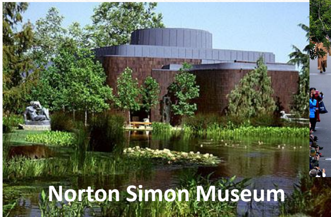
Norton Simon Museum